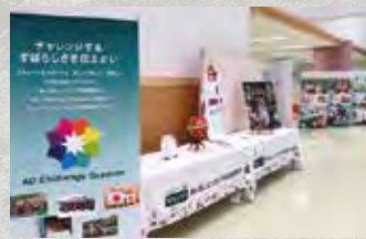
〈あいおいニッセイ同和損害保険株式会社〉